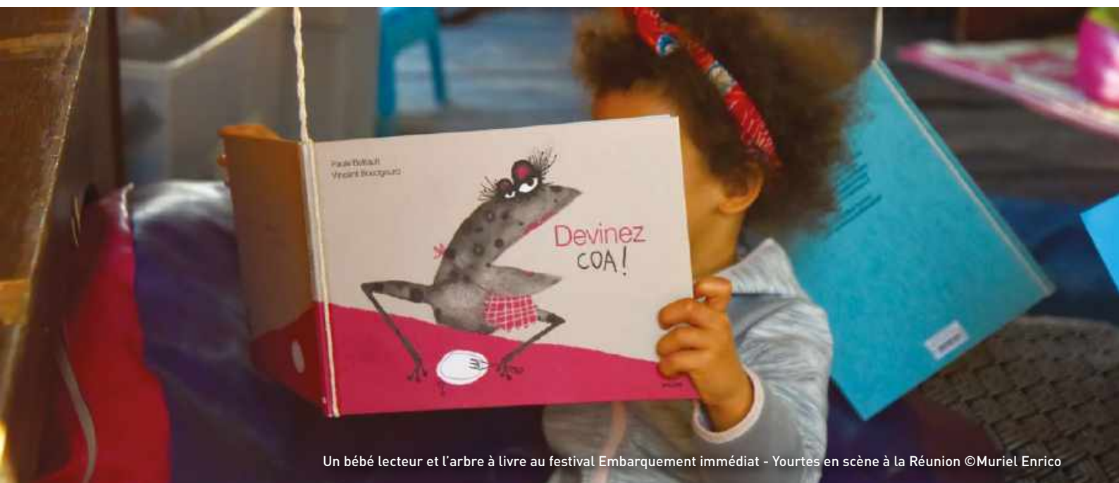
Un bébé lecteur et l'arbre à livre au festival Embarquement immédiat - Yourtes en scène à la Réunion

Le CNL a été visible, avec plus de 180 citations dans la presse soit 30 % des articles contre 47 % l'année dernière. Cette baisse peut s'expliquer par l'absence de conférence de presse et d'un lancement à Paris, ou tout autre moment institutionnel fort pour incarner l'institution organisatrice. Le partenariat avec Le Figaro a été bénéfique pour lancer la notoriété de la fête, à une semaine du lancement, quand la presse quotidienne nationale a délaissé la manifestation pour des sujets « plus chauds » : coronavirus, plan de relance et remaniement ministériel.