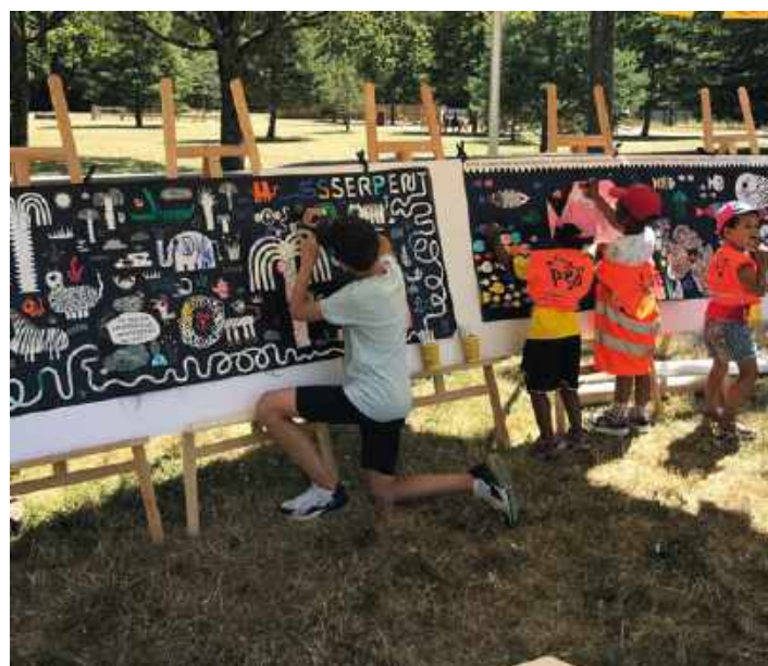
Réalisation d'une fresque collective autour de l'illustratrice CHAMO

Les événements labellisés assurent un ancrage territorial fort et le soutien du CNL à des événements d'ampleur est essentiel pour garantir la diversité et la qualité des propositions éditoriales de la fête.