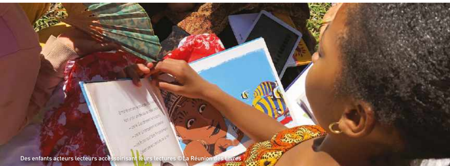
Des enfants acteurs lecteurs accessoirisant leurs lectures