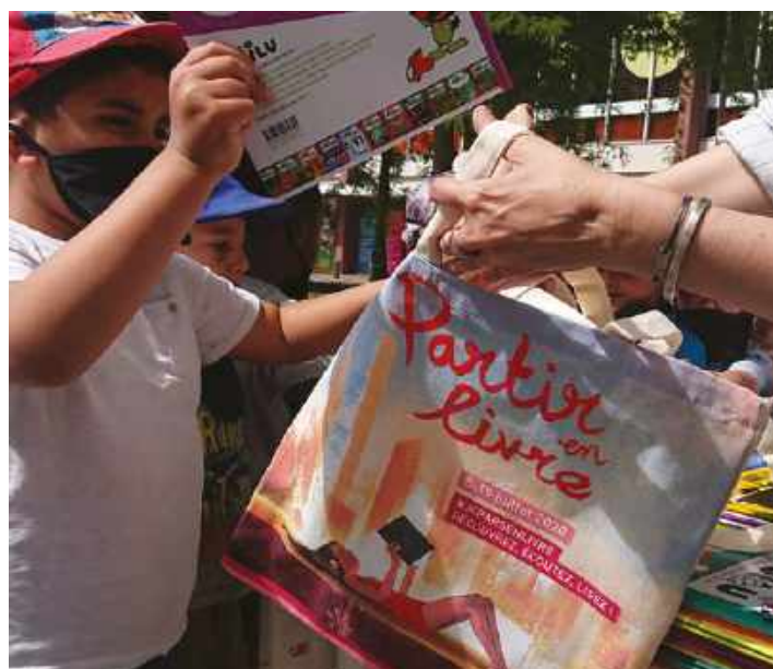
Des livres offerts dans le cadre des ParcoTruc(k)s du Salon du livre et de la presse jeunesse en Seine-Saint-Denis

Pendant 3 semaines, du 8 au 25 juillet, 25 000 parents et enfants ont assisté à la tournée des ParcoTruc(k)s. 4 camions avec comédiens et animateurs ont sillonné 20 communes du département de Seine-Saint-Denis pour faire escale aux pieds des immeubles, dans les centres villes et les parcs. De plus 1 000 temps d'ateliers, de jeux littéraires et de lectures ont été proposés aux familles et aux groupes des centres de loisirs. 28 000 cahiers de vacances littéraires et ludiques, imaginés par le SLPJ-93, proposant des jeux autour de 9 héros de bande dessinée jeunesse, ont été offerts. Les enfants ont également pu repartir, grâce aux Chèques Lire du CNL, avec les BD qui ont inspiré ces cahiers, ou choisir un livre parmi les 13 000 dons d'éditeurs jeunesse. La tournée des ParcoPlages, dans 5 îles de loisirs de la région Île-de-France, et le projet « l'Été culturel des livres à soi » avec 60 bibliothèques, ont prolongé l'action des ParcoTruc(k)s pendant l'été.