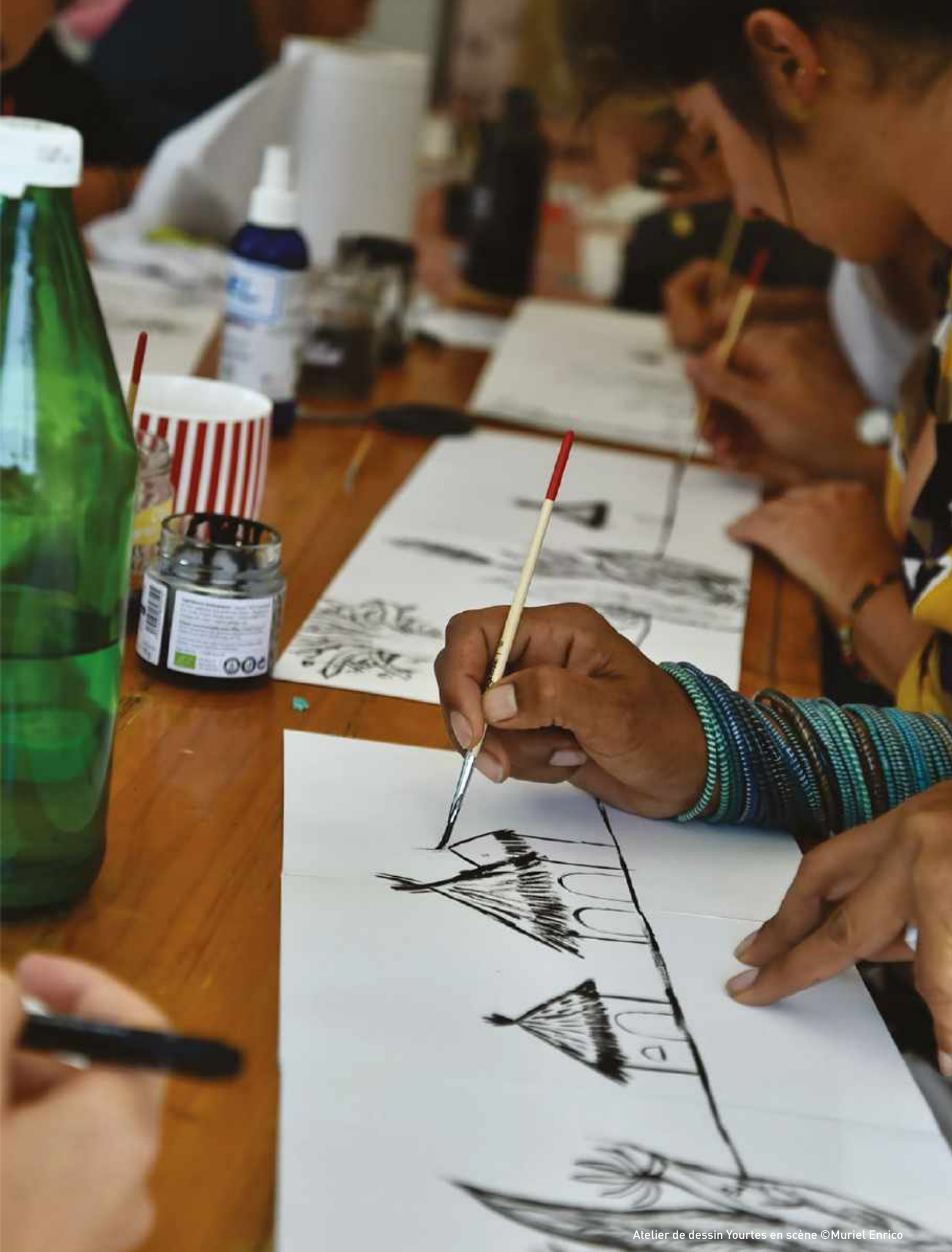
Atelier de dessin Yourtes en scène