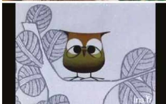
De haut en bas : Yétli (France Télévisions) et Une histoire de Madame La Pie (INA Kids)