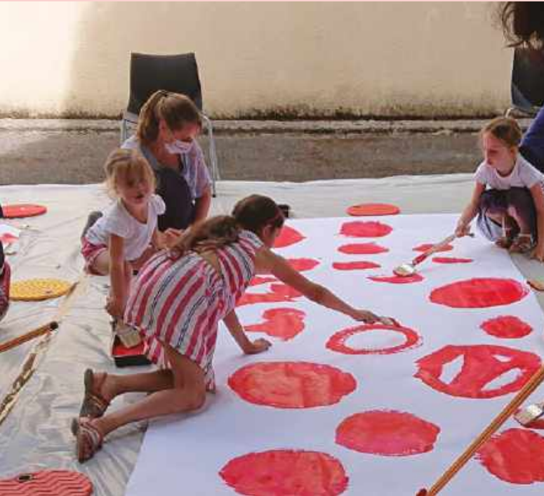
Atelier lors de "Jouons, lisons à Valenton"

Parmi ces événements labellisés, 12 projets ont reçu l'appellation de « projet remarqué ». Ces projets répondent à plusieurs critères d'appréciation, dont la cohérence du projet littéraire, l'interaction des acteurs de la chaîne du livre, les actions d'éducation artistique et culturelle, l'implication des acteurs locaux (les librairies et les bibliothèques) et le rayonnement territorial du projet.